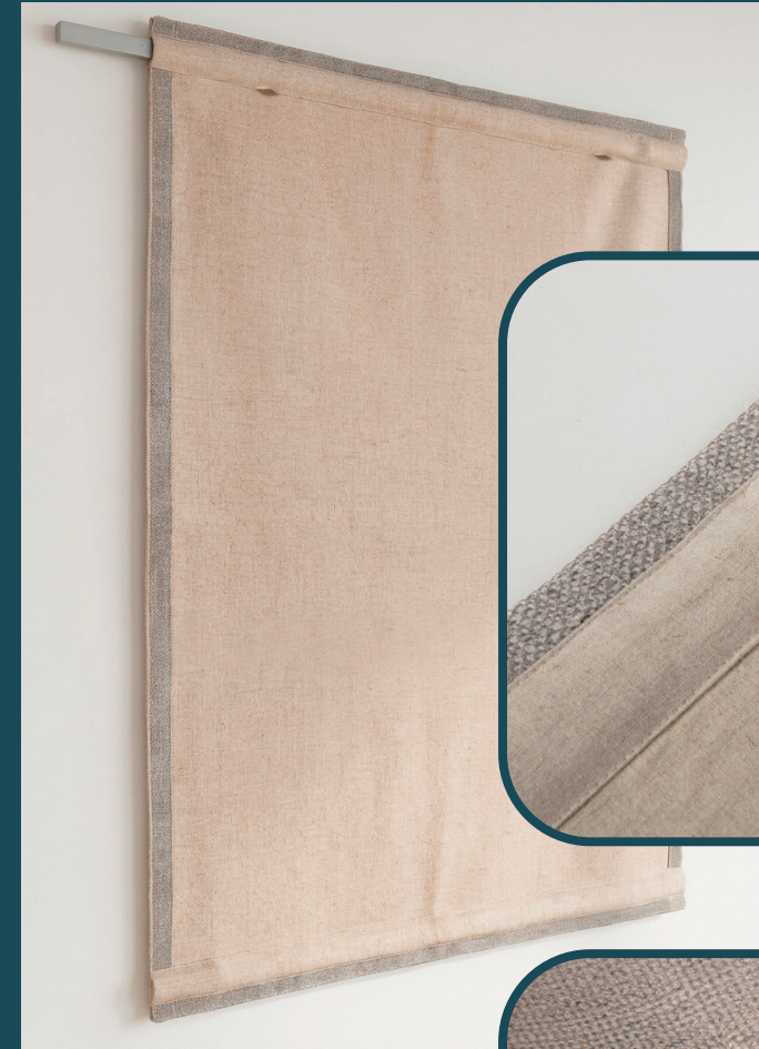
Sistema de colgado Hanging System