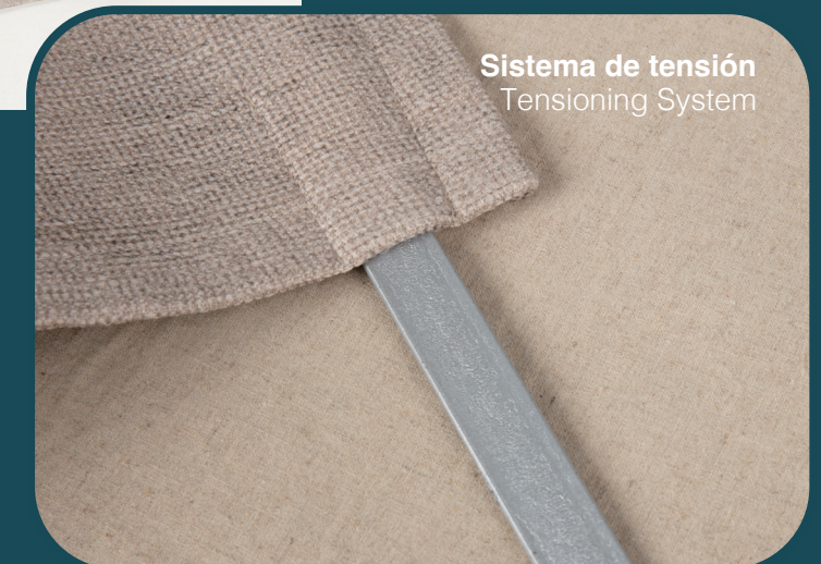
Sistema de tensión Tensioning System